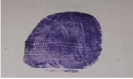
Applicant Thumb Impression