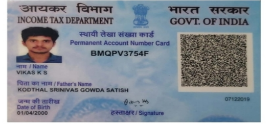
Applicant's Identity Card / ಅರ್ಜಿದಾರನ ಗುರುತಿನ ಚೀಟಿ